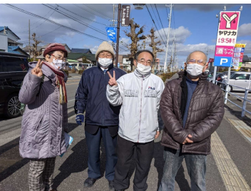
19行動で「条約批准」の署名を呼びかけ1/19

2020年9月30日現在、全国自治体数1724のうち総計1653自治体 95.88%が実施している非核自治体宣言も碧南市は行っていません。ねぎた市長はヒバクシャ署名も政府への批准の要求もしていません。市民の反核平和の世論で市も国も変えましょう。