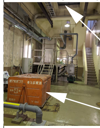
落下した開口部とダストボックス

日本共産党山口、岡本両議員は15日現地視察を行いました。下水汚水を蜷川対岸に送る施設で、月1回委託業者が集塵筒の袋（微量）を交換し年に1回、地下施設内のダストボックス2個をクレーンで6mつり上げ改修していました。機械修繕用の開口部から落下したのです。月ごとに屋外にダストボックスを移動すれば危険なクレーン作業は回避できた。と部課長に作業工程の見直しを求めました。