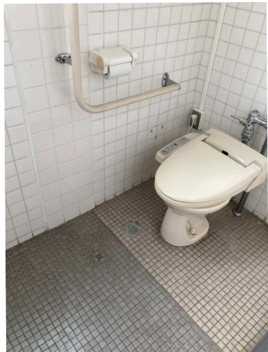
西端中学階ごとに2カ所。一カ所に8個のうちの唯一の洗浄機能付き洋式トイレ。黒い輪じみがこびりついている。4室は和式トイレ。

緊急に業者清掃を依頼しました。また、1室ごとに清掃ブラシを置いて、自分が汚した場合は、きれいになれるようにすること。洗浄薬剤