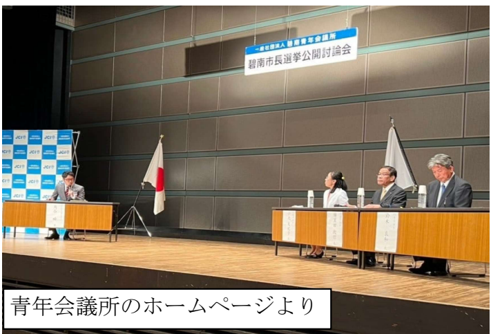
青年会議所のホームページより

そのトップに立つ市長が、犯罪的な多額の献金。洗脳で人権や家族のしあわせも奪う団体を容認、19歳からドッグリと浸かってきたのです。到底、相いれることはできません