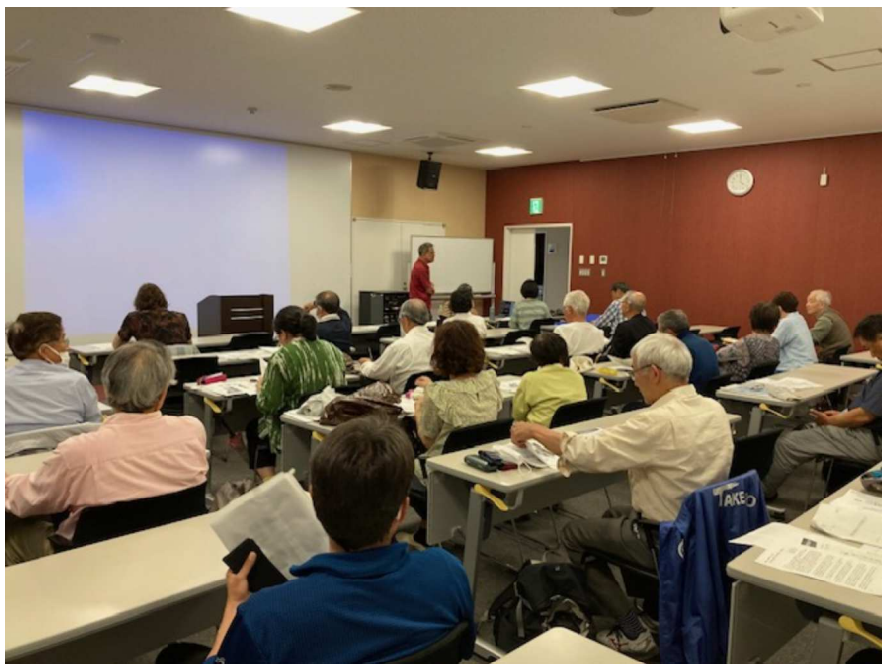
会場いっぱいの、知多半島や周辺からの参加者 5/19