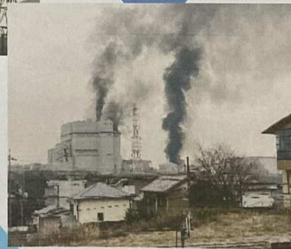
1月31日の爆発・火災事故 左上、バンカーからベルトコンベアを伝って燃え広がる様子。 右下は、地元の富貴砂水(さみず)から発電所は道路一本を挟んだ距離