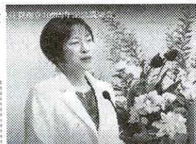
田村智子委員長の102周年記念講演 日本共産党ホームページからご覧ください。