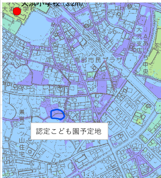
認定こども園予定地

さっそく説明会が開催されることになりました。都合のつく時間帯を選んで市の説明を聞くとともに、みなさんの声を届け、共に安心して子育てできる街を作っていきましょう。