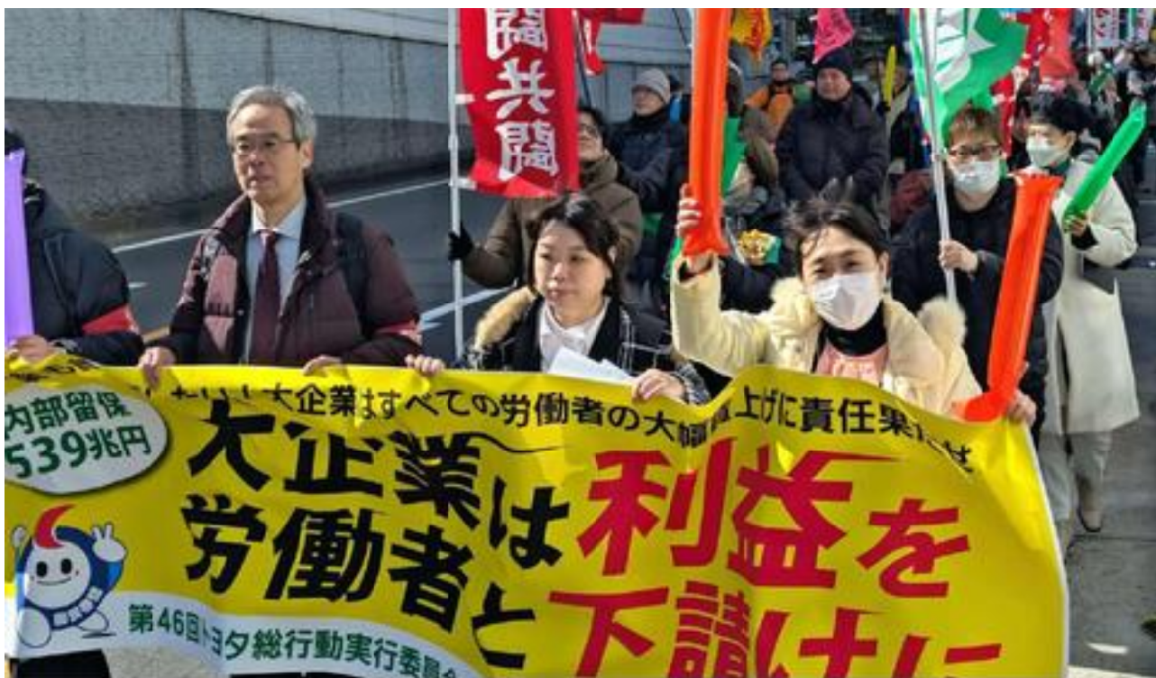
(写真) 「内部留保を賃上げ、下請け単価引き上げに回せ」と声を上げる人たち = 11日、名古屋市

社会的な責任果たせ!! 愛知県内各所で11日、大幅賃上げと下請け単価引き上げを求めて、第46回トヨタ総行動が行われました。トヨタ総行動実行委員会、全労連、愛労連、愛知国民春闘共闘委員会の呼びかけで、集会、宣伝などが取り組まれ、全体で延べ約600人が参加。トヨタ・大企業は社会的責任を果たせ!! の声が響きました。