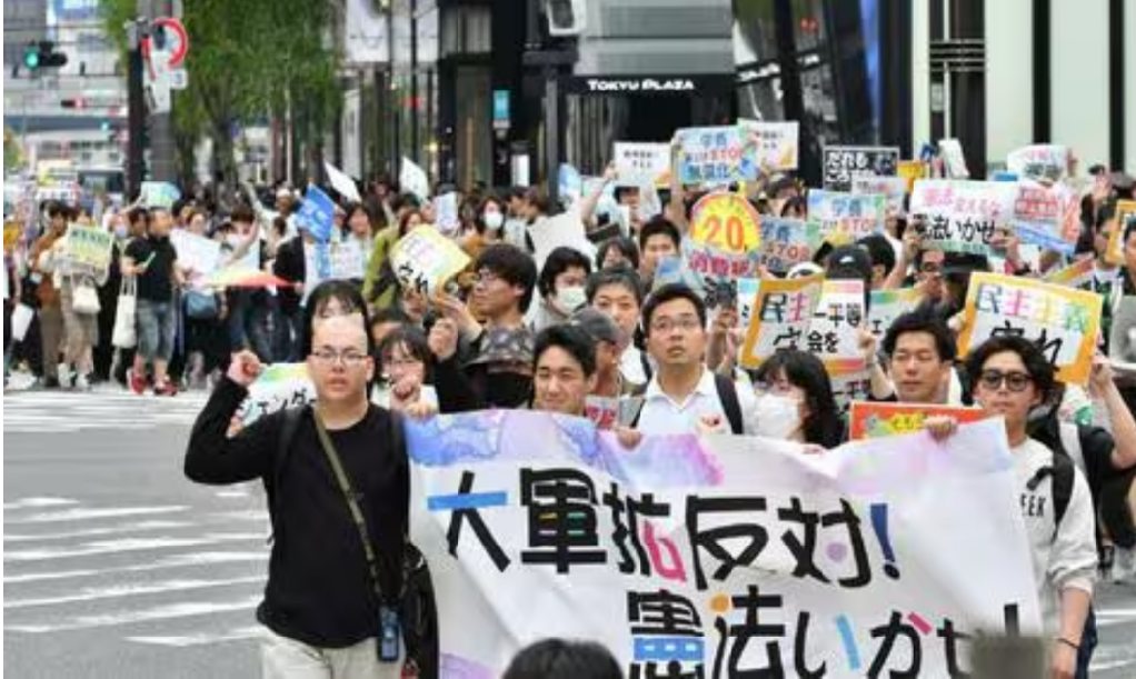
(写真)「憲法守れ」と声をあげながらデモ行進する青年たち ＝25日、東京都中央区