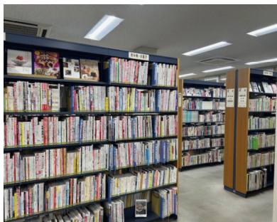
碧南市の図書館はスゴイ!!