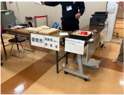
顔写真付き証明カードの申請でゴッタがえすサンビレッジロビー 4/1